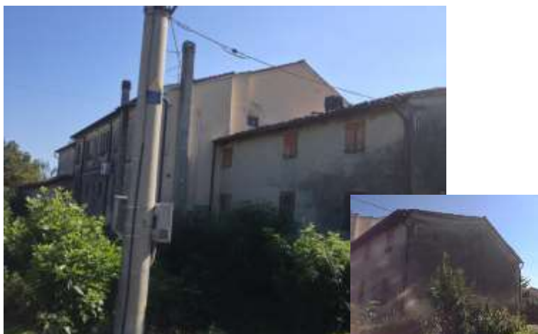
Ristrutturazione post sisma