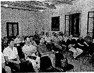
Una riunione dell'Ordine